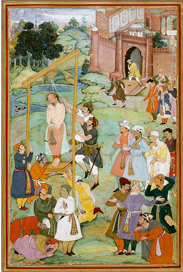
سیندار دانا حه لاجی (۸۵۸ - ۹۲۲) میناکه ک لدور شه شکه نجه دانا سو فیان زبه ر بیرو باوه رین وان بین نایینی.

خو دا ئاماژه ب ئەفی مهزه بهی کر بیت و ب ناشکرا ئاماژه دابته هر ووفیه تی، به لی ئەگه هر هور به ری خو ب دهینه هنده ک ژ هه لبه ستین وی دی بینین تا پاده یه کی کارتیکرن ل سهر هه بوویه، چونکی هر ووفیان ژ تر سا شیر و شه شکه نجی خو د ناف ته ریفه ت و مهزه بهین دی بین سو فیگه ری دا فه شارتی یه و بیر و باوه رین وان تیکه له لی ئیک بووینه تا وی پاده ی ب زه حمه ته بیرو باوه رین وان ب یه قین بهینه دیار کرن و ب زه حمه ته گه له ک ژ زانا و هه لبه ستفانان ژ ی ب ته مامی ب دهینه پال وان، تابه ت ژ بهر شیوازی نهینی یی ته ریفه ت و بزاقین ته سه و فی کو رامانین وان د باطن دا نه (۱۸) .