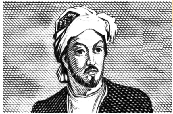
عیمادهددین نھسیمی (۱۳۶۹ - ۱۴۱۷)

فہرہددینئ (عہجمی) سہردہمئ (سولتان موحممہد فاتحئ عوسمانئ)؛ کۆمہکا حرروفی یان ب ساخی ہاتنہ سۆتن، ل سہردہمئ سولتان سولہیمائئ قانونی (م: ۱۵۶۴) حرروفی ہاتنہ دہریخستن ژ دہولہتا عوسمانئ (۱۵) .